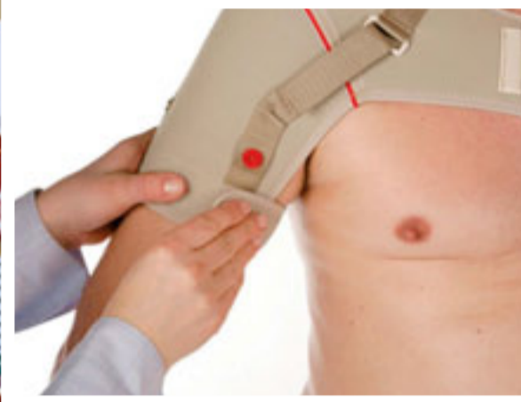
Oikeanlainen tuki lievittää aivohalvauspotilaan olkapääkipua, kertoo Respectan Piia Parikka.